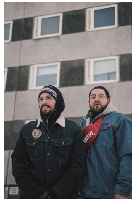
BOSS OG FELA. Brødrene foran den norske hip-hopens vugge, en grå blokk i Groruddalen.