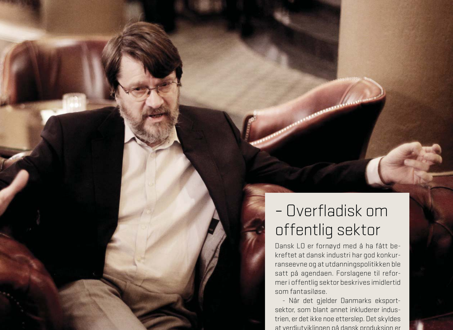
den danske Produktivetskommisjonen. Nå sitter han som medlem i den norske kommisjonen.

- Utviklingen i Norge har vært vesentlig bedre enn i Danmark, og Norge har for eksempel ikke hatt så svak produktivitetsvekst i tjenestesektoren som vi har sett i Danmark. Men Norge har opplevd en svekkelse i produktivitetsveksten siden 2005, noe som gir god grunn til å undersøke hva som kan gjøres for å styrke utviklingen.