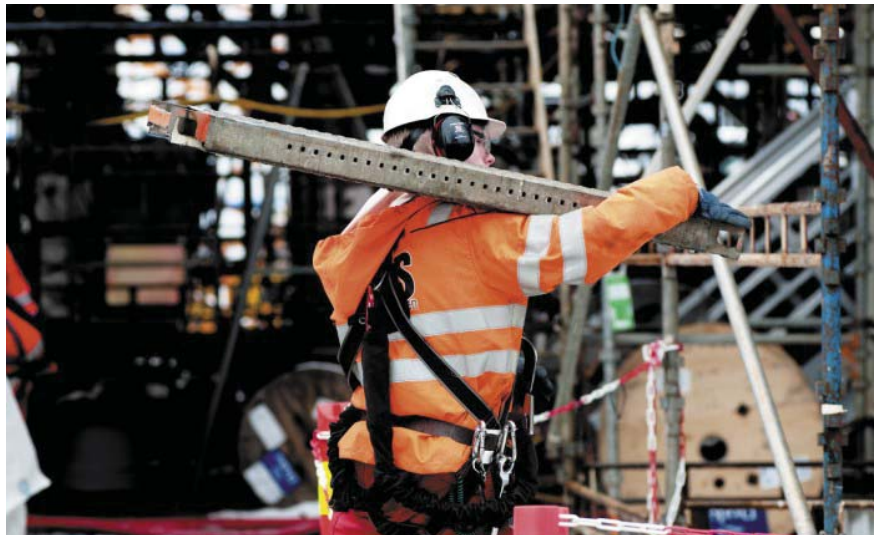
PRODUKTIV: Velferdsstaten er fundamentet for den høye produktiviteten i norsk arbeidsliv, skriver LO-Aktuelts redaktør.

TRYGGHET. Men selve fundamentet er en velferdsstat som legger alt til rette for at vi kan føle oss trygge. Det gjør det enklere å omstille virksomheter fordi vi vet at ungene kan fortsette i barnehagen, helseforsikringene og pensjonen forsvinner ikke med jobben slik den gjør i mange andre land. Og