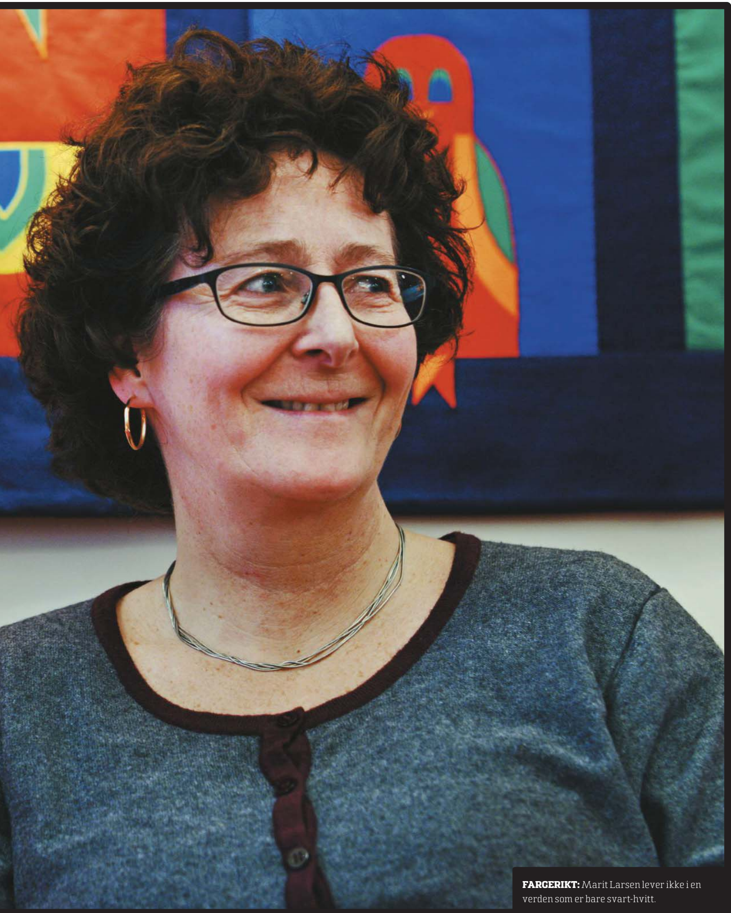
FARGERIKT: Marit Larsen lever ikke i en verden som er bare svart-hvitt.